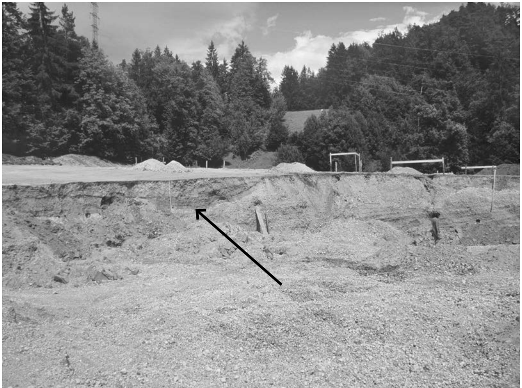
Slika 2 : Celotno zaporedje lehnjakovih vršajnih sedimentov, razkrito ob izkopu gradbene jame za usedalnik čistilne naprave. Puščica kaže začetek pojavljanja lehnjakovih tvorb.

Evidentiran premik ob prelomu po vpadu je 70 cm. Na terenskem sestanku se je investitor na podlagi veljavnega gradbenega dovoljenja in nujnosti izgradnje čistilne naprave kljub temu odločil za nadaljevanje izkopa, terenske raziskave pa so se nadaljevale po programu. Poročilo o terenskih raziskavah s predlogom nadaljnjih laboratorijskih raziskav je bilo izdelano 12. 9. 2005 (Košir et al., 2005).