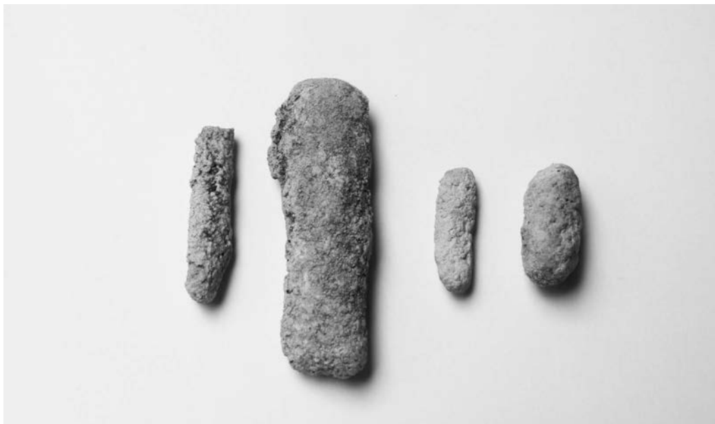
Slika 4: Cilindrični onkoidi sestavljajo onkoidni lehnjak, velikost od 2,5 do 5,5 centimetra.

Figure 4: Cylindrical oncolites in the oncolite tufa, size from 2.5 to 5.5 centimetres.