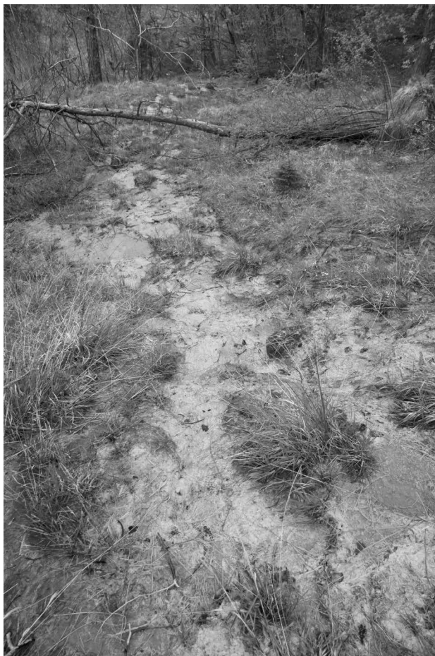
Slika 8: Mokrišče Berje pri Zasipu. Figure 8: The Berje pri Zasipu fen.

Na položnem območju mokrišča se ob intenzivni karbonatni sedimentaciji izločajo podobne lehnjakove tvorbe, ki so bile najdene tudi južno od Blejskega jezera, med katerimi prevladujejo klastične oblike lehnjaka (Košir et al., 2006). Nepravilni cianobakterijski onkoidi rastejo in situ v plitvih depresijah s stoječo ali počasi tekočo vodo, pizoidi nastajajo v prepletajočih se kanalih s hitrotekočo vodo, fitohermne tvorbe ob šopih trave ali kopusah mahov, mikrodetritični lehnjak pa se odlaga v (pol)zaprtih depresijah. Strokovnjaki zato domnevajo, da je recentni facies na Berju analogen karbonatnim tvorbam na vršaju med Obročem in Kozarco.