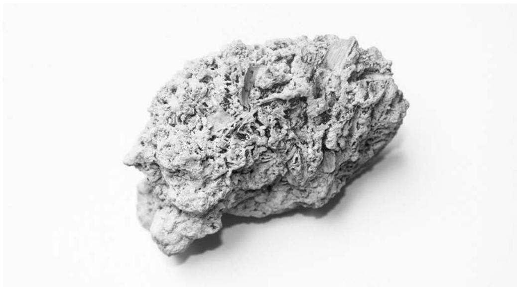
Slika 5: Fitoklastični lehnjak zgrajen iz slabo inkrustriranih rastlinskih ostankov, velikost 9 centimetrov.

Figure 4: Cylindrical oncolites in the oncolite tufa, size from 2.5 to 5.5 centimetres.