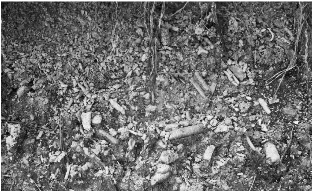
Slika 6 : Lehnjakove tvorbe ob poti na Kozarco.

Območje lehnjakovih tvorb je dobro ohranjeno v okolici čistilne naprave. Izdanki z lehnjakom so dobro vidni tudi na brežini ob poti na Kozarco (Slika 6). Po raziskanem terenu ocenjujemo, da sta ohranjeni približno dve tretjini površine pojava.