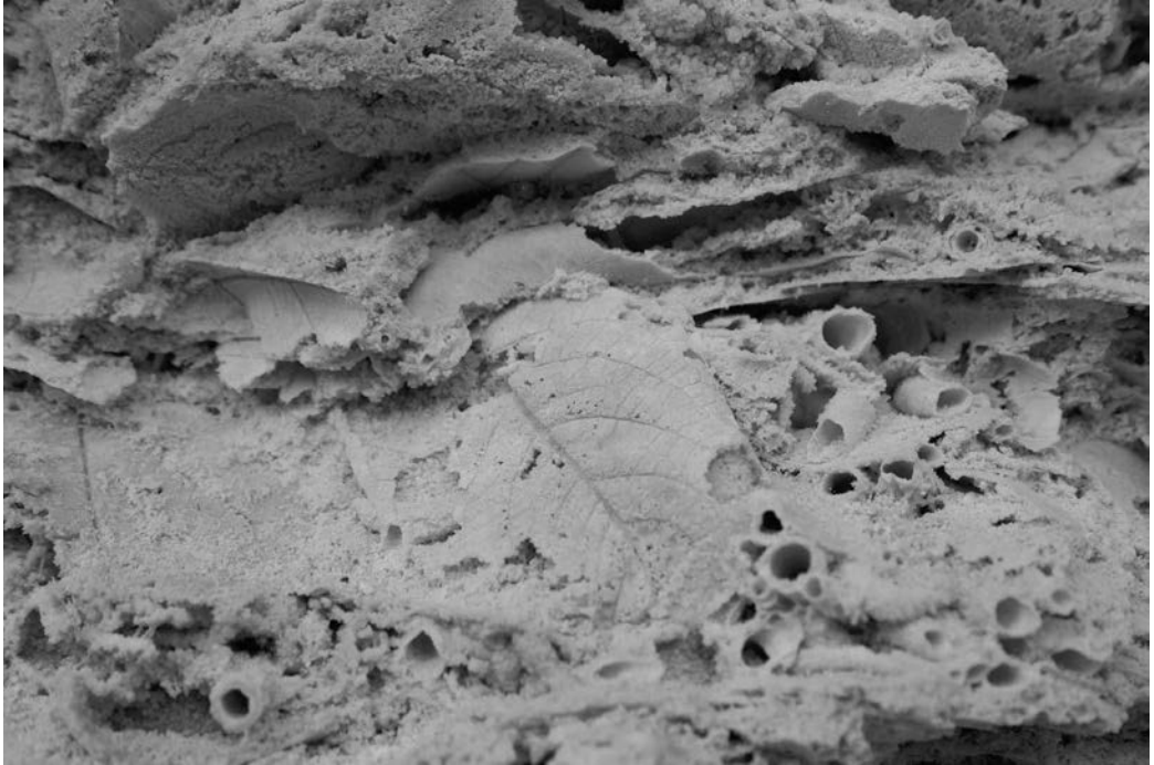
Slika 7: Lehnjak z odtisi listov in vejic iz kamnoloma v dolini Komatevre na Spodnjem Jezerskem. Figure 7: Tufa with leaf imprints and twig moulds from the quarry in the Komatevra Valley in Spodnje Jezersko.

robu naselja Volavlje pri Ljubljani in ob izviru nad reko Kokro na Spodnjem Jezerskem. V bližini zadnjega je tudi eno največjih lehnjakovih nahajališč v Sloveniji, ki so ga v dolini Komatevre v preteklosti izkoriščali v kamnolomu kot mineralno surovino (Slika 7).