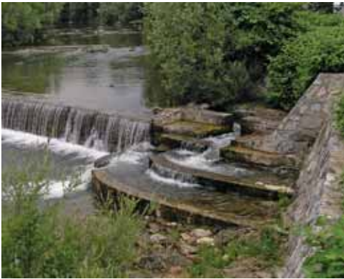
Slika 3: Ribja steza ob Okornovem jezusu. Fig. 3: Fishpass along the Okorn dam.

Obnovljen Šeširjev jez iz leta 1985 z višino 2,7 m pregrajuje Selško Soro v Škofji Loki. Podobno kot pri Okornovem jezusu je na levem robu slabo delujoča ribja steza bazenskega tipa (Slika 4). Vhod je predaleč od glavnega toka, steza ima previsok vhodni prag in prestrm naklon.