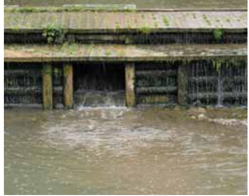
Slika 6: Ribja steza na Puštalskem jezju. Fig. 6: Fishpass on the Puštal dam.