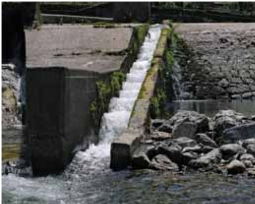
Slika 7: Ribja steza na jezcu za mHE Niko. Fig. 7: Fishpass on the dam for Niko small-scale hydro plant.