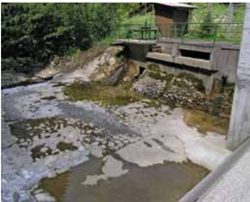
Slika 9: mHE Davča 1

Opisana sta le najbolj kritična primera na pritokih Selške Sore, kjer je gradnja in delovanje mHE popolnoma spremenila morfološke in hidrološke lastnosti vodotoka. Gradnja zajetja pri mHE Davča 1 (Slika 9) in mHE Fari potok (Slika 10) je obsegala betonsko utrditev dna struge in brežin vodotoka ter prekinitev migracijskih poti. Pri izkoriščanju vode za pridobivanje električne energije se običajno ne zagotavlja Q_{es} , posledica česar je suha struga dolvodno od zajetja.