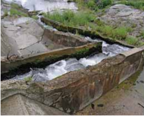
Slika 5: Ribja steza na jezju mHE Goričane. Fig. 5: Fishpass on the Goričane small-scale hydro plant.