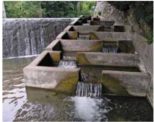
Slika 4: Ribja steza ob Šeširjevem jezusu. Fig. 4: Fishpass along the Šešir dam.