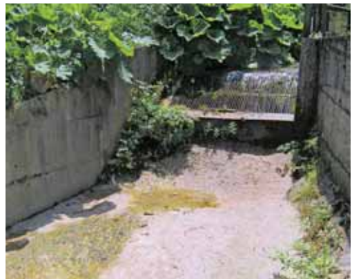
Slika 10: mHE Fari potok

Fig. 9: The Davča 1 small-scale power plant