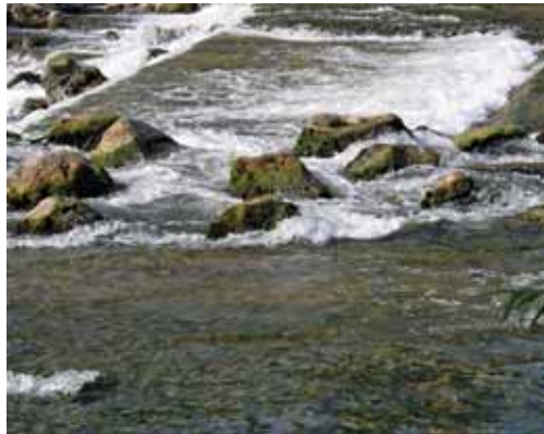
Slika 8: Ribja steza na pragu v Medvodah. Fig. 8: Fishpass on the cascade in Medvode.