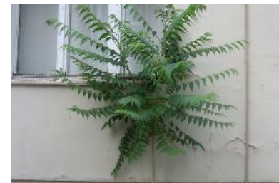
Avtor: Breda Ogorelec