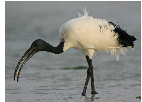
Avtor: Steve Garvie