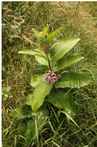
Avtor: Darja Erjavec