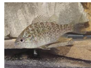
Avtor: Paul Veenvliet