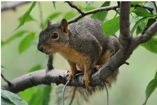
Avtor: Stefan Hageman