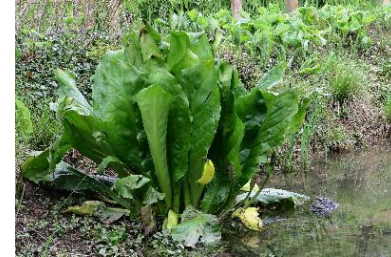
Avtor: Zavod Symbiosis