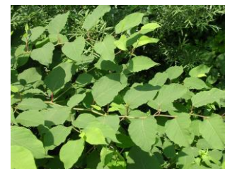
Avtor: Nejc Jogan