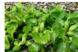
Avtor: Zavod Symbiosis