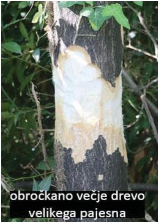
Slika 3: Obročano drevo pajesna (Cernic et al., 2022).

Figure 3: Girdled tree of heaven (Cernic et al., 2022).