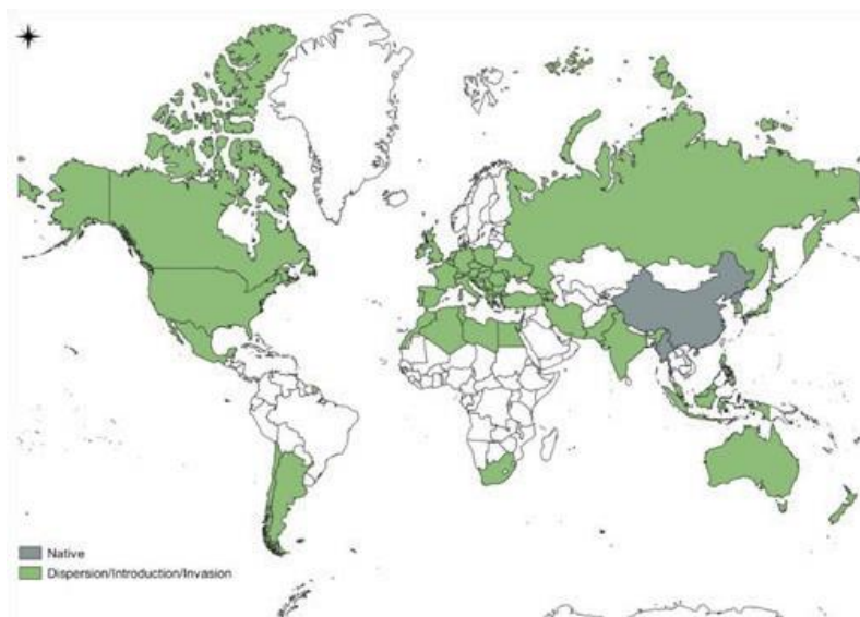
Slika 1: Globalna razširjenost velikega pajesna (siva barva – naravna prisotnost, zelena barva – umeten vnos ali invazivna razširitev).

ustrezajo bazična tla, medtem ko slabše prenaša tla z nevtralno pH vrednostjo. Hranila v tleh imajo manjšo vlogo. Raste na skoraj vseh tipih tal, najbolj mu ustrezajo globoka tla, bogata s črnozjomom, ali aluvialna tla, raste tudi na kamnitih in peščenih tleh (Meseldžija et al., 2019). Pogosto ga najdemo v mestih, na ruderalnih rastiščih, ob robovih hiš, ob cestah, na gradbiščih, ob potokih, na nasipih ter opuščenih kmetijskih površinah.